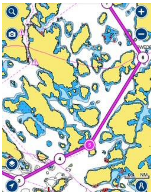
3 Väst Karklö