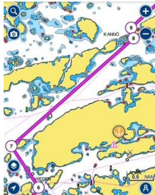
4 Ost Idholmen, Väst Oxholmen