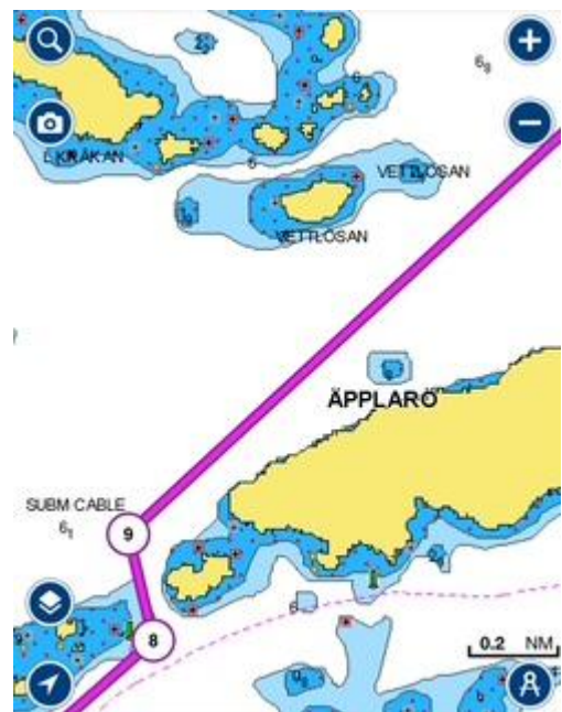
5 Väst Äpplarö med tillhörande lilla ö