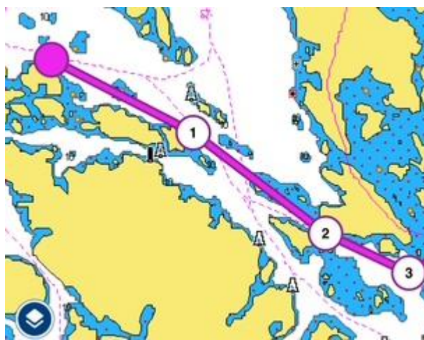
2 Syd Grinda