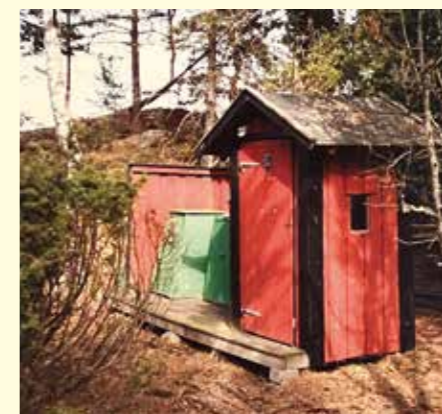
Ett av Skärgårdsstiftelsens traditionella dass med sopstall.