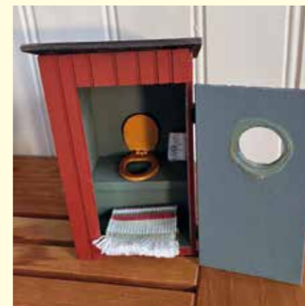
Redaktörens eget mini-dass i dockskåpsformat.