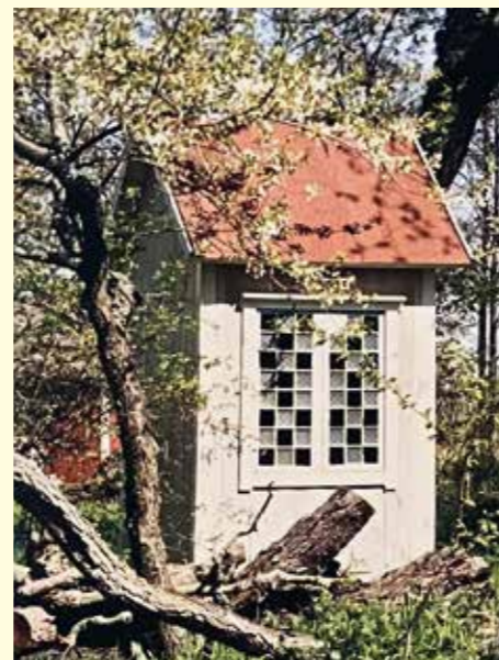
Ett gulligt privat dass på Rödlöga.

Dass: Tyskans das Haus = Huset, das Häusche = Det lilla huset Avträde: Tyskans Abtritt = Där man drar sig tillbaka Hemlighus: Tyskans heimlich = hörande till huset