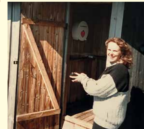
Dass på Svenska Högarna