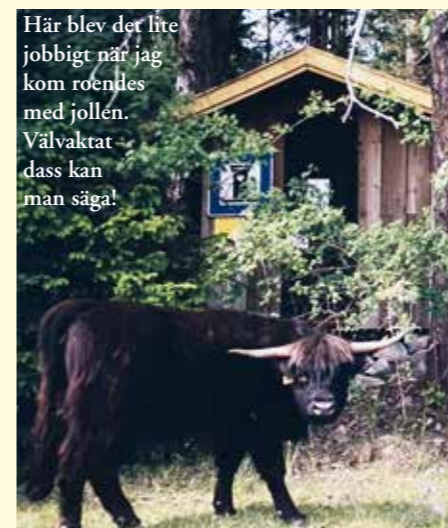
Här blev det lite jobbigt när jag kom roendes med jollen. Välvaktrat dass kan man säga!