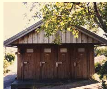
Dassen på Björkskär, alltid många besökare så ibland blir det kö.