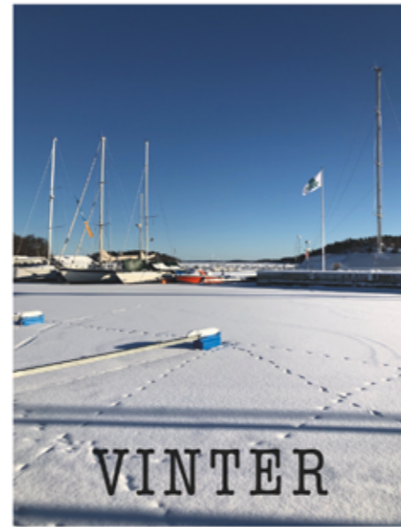
Isen ligger tjock över sjön. Med snön som ett täcke.

Genom att trycka på den blå informationsknappen i mitten, markerad med ett "i" får du instruktioner som hjälper dig att utföra Hjärt-lungräddning (HLR).