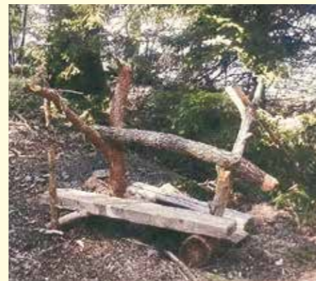
Ett spartanskt hemmabygge på en ö vid Stora Skratten.