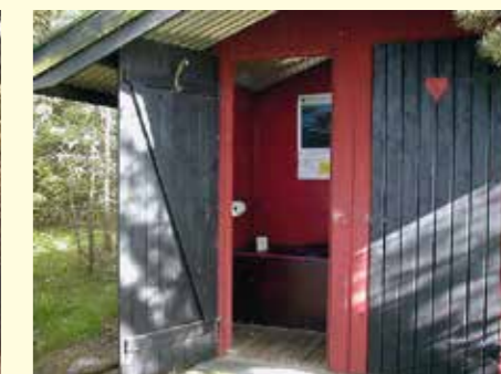
Välskött dass på Utö