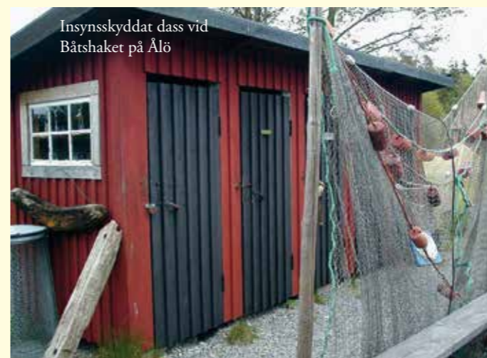
Insynsskyddat dass vid Båtshaket på Ålö