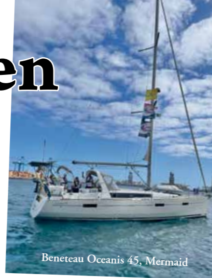
Beneteau Oceanis 45, Mermaid

Matte – storfiskare, däcksgasell, problemlösare på hög höjd och till vardags hamnkaptan